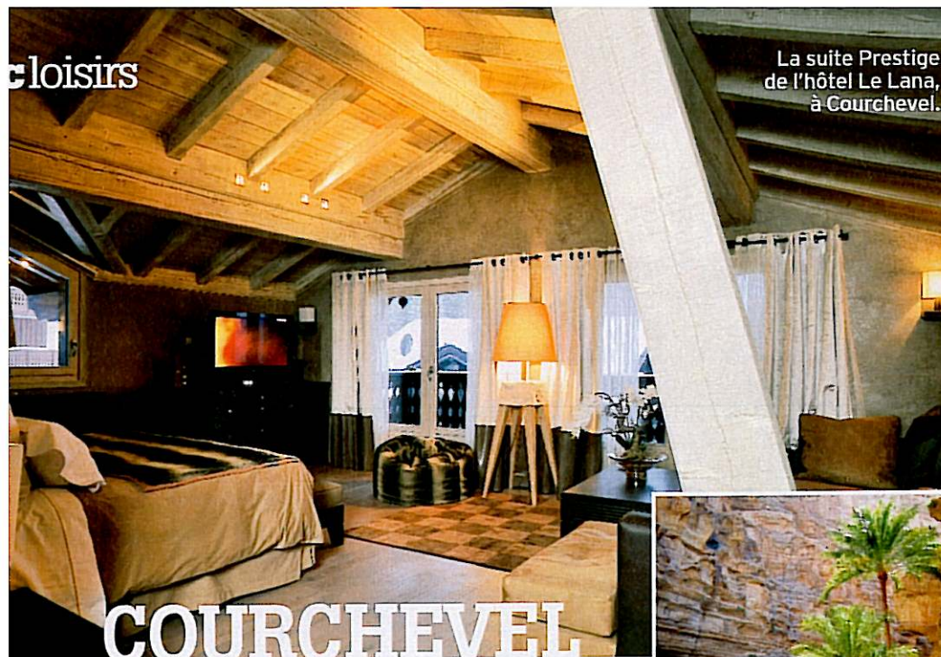
La suite Prestige de l'hôtel Le Lana, à Courchevel.