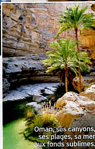
Oman, ses canyons, ses plages, sa mer aux fonds sublimes.

Le forfait Bien-être by Clarins de six jours/sept nuits pour deux personnes comprend la demi-pension, hors boissons, le petit-déjeuner continental, un massage ou un soin par personne et par jour, et un cadeau Clarins. A partir de 4940 € la chambre, du 14 au 28 mars, suivant disponibilités. Taxes de séjour (1,65 € par personne et par jour) en sus. Hôtel Le Lana, BP 95, 73121 Courchevel 1850, 04 79 08 01 10, www.lelana.com .